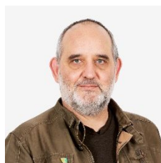
Yvan Luccarini Syndic de Vevey