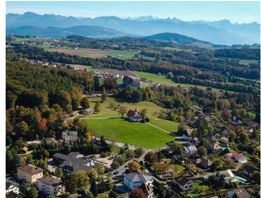
© Coopérative du logement - Epalinges